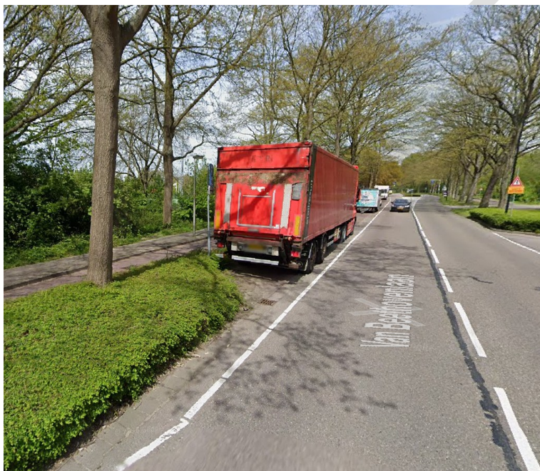
Locatie Van Beethovenlaan

In Voorschoten is het grotendeels verboden om grote voertuigen te parkeren. Grote voertuigen zijn voertuigen die, inclusief lading, langer zijn dan 6 meter en hoger zijn dan 2,40 meter. Dit hebben we geregeld in artikel 5:8 van de Algemene Plaatselijke Verordening (APV). Het college heeft drie locaties aangewezen waar wel geparkeerd mag worden met grote voertuigen, namelijk langs de Van Beethovenlaan, Trompweg en op het Burgemeester van der Haarplein.