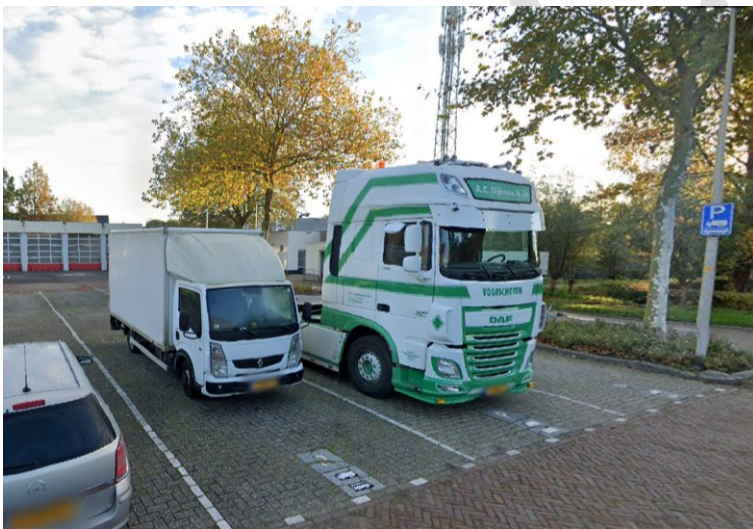
Locatie Burgemeester Van der Haarplein

We vinden het parkeren van grote voertuigen op het Burgemeester van der Haarplein onveilig. Aan het plein is namelijk ook een school en sporthal gelegen. Daarnaast ligt het parkeerterrein midden in het centrum. Onnodige vrachtwagenbewegingen zijn hier niet gewenst. We hebben daarom op 22 januari 2025 een verkeersbesluit genomen om de parkeerplaatsen voor vrachtwagens en bussen op het Burgemeester Van der Haarplein op te heffen. Deze parkeerplaatsen worden gecompenseerd op de Van Beethovenlaan en de Trompweg.